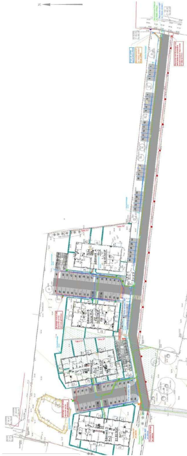
Annexe 2 : Plan des réseaux souples

Convention de rétrocession des espaces communs Opération Le Domaine des Charmille – 20 Rue des Goubins – MONTS