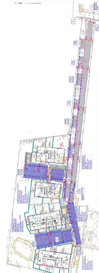
Annexe 3 : Plan des réseaux EU et EP

Convention de rétrocession des espaces communs Opération Le Domaine des Charmille – 20 Rue des Goubins – MONTS